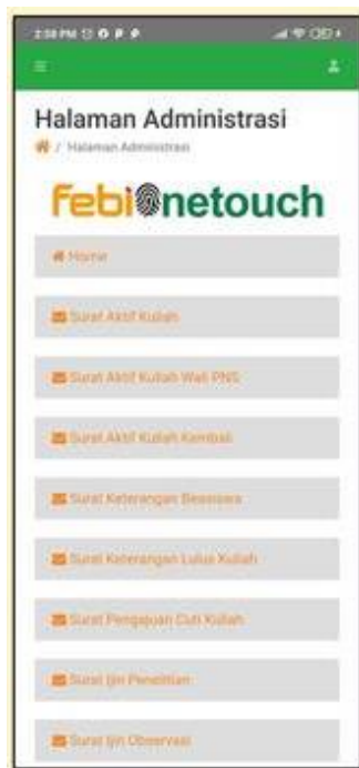
Gambar 1. Tampilan halaman aplikasi FebiOnetouch