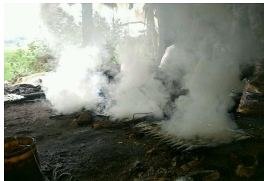
Gambar 1 Pengasapan Ikan dengan Metode Tradisional

ini menyebabkan pengolahan pengasapan ikan masih dilakukan secara tradisional dengan cara membuat galian tanah sesuai ukuran yang diinginkan dan menempatkan bahan bakar yang berupa batok/tempurung kelapa diatasnya kemudian diletakkan rak pemanggang ikan. Hal ini akan sangat berpengaruh terhadap produksi dan kualitas ikan asap, karena dengan proses pengasapan seperti itu kurang higienis, karena model pengasapan masih ditempat terbuka dan menempel dengan tanah. Sedangkan pengasapan yang dilakukan di tempat terbuka membuat asap menyebar kemana- mana yang dapat mengganggu polusi udara dan kenyamanan masyarakat setempat. Hal ini dapat dilihat dari gambar dibawah ini: