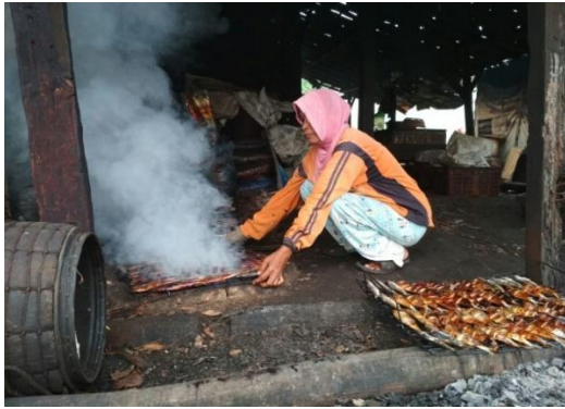
Gambar 1 Pengasapan Ikan dengan Metode Tradisional

Alat pengasapan ikan ramah lingkungan ini memungkinkan masyarakat kelompok pengrajin ikan asap dapat melakukan proses produksi setiap hari tanpa khawatir mengganggu kenyamanan masyarakat sekitar dan hasilnya juga lebih higienis. Alat pengasap ikan ramah lingkungan ini berfungsi untuk mengasap ikan lebih higienis dan dapat mengurangi polusi udara yang dapat mengganggu kenyamanan lingkungan sekitar. Sehingga dengan adanya alat/mesin pemanggang ikan yang ramah lingkungan itu diharapkan produktivitas bisa ditingkatkan yang diharapkan akan dapat berimbas pada tingkat pendapatan masyarakat pengasap ikan sehingga kesejahteraan dapat tercapai. Rancangan model alat pengasap ikan ramah lingkungan ini dapat dilihat pada gambar dibawah ini: