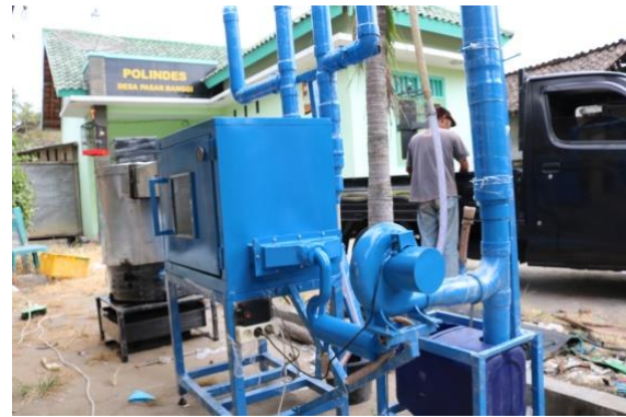
Gambar 4 Alat Pengasap Ikan

Setelah diperoleh peserta penyuluhan dan pelatihan PKM STIE YPPI Rembang, maka dilakukan penyuluhan tentang pentingnya/manfaat kelompok bagi pengolah ikan asap yang dilanjutkan dengan memperkuat peran kelompok.