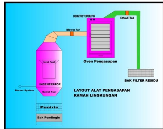
Gambar 3 Rancangan Model Alat Pengasap Ikan Ramah Lingkungan

Alat pengasapan ikan ramah lingkungan ini memungkinkan masyarakat kelompok pengrajin ikan asap dapat melakukan proses produksi setiap hari tanpa khawatir mengganggu kenyamanan masyarakat sekitar dan hasilnya juga lebih higienis. Alat pengasap ikan ramah lingkungan ini berfungsi untuk mengasap ikan lebih higienis dan dapat mengurangi polusi udara yang dapat mengganggu kenyamanan lingkungan sekitar. Sehingga dengan adanya alat/mesin pemanggang ikan yang ramah lingkungan itu diharapkan produktivitas bisa ditingkatkan yang diharapkan akan dapat berimbas pada tingkat pendapatan masyarakat pengasap ikan sehingga kesejahteraan dapat tercapai. Rancangan model alat pengasap ikan ramah lingkungan ini dapat dilihat pada gambar dibawah ini: