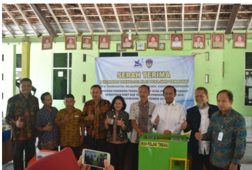
Gambar 4. Serah terima mesin perajang tembakau ke warga

Setelah mitra memahami cara pengoperasionalan dan perawatan mesin perajang kemudian mesin perajang tembakau diserahkan kepada kelompok untuk digunakan sebagai alat produksi.