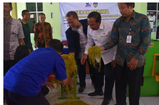
Gambar 3. Praktek penggunaan mesin perajang tembakau oleh warga