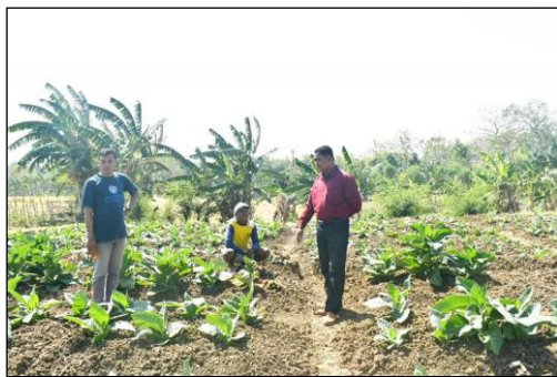
Gambar 1. Survey lokasi petani tembakau di Desa Tumbrasanom

perajang tembakau tenaga diesel yang bisa mobile dibawa kemana saja di sawah, selama ini warga kesulitan mencari mesin perajang tembakau tenaga diesel. Penggunaan Mesin perajang tembakau dapat berdampak besar pada kapasitas produksi. Pemilihan elemen alat dan mesin juga perlu diperhatikan untuk tujuan efisiensi (Sugandi dkk., 2016). Penerapan mesin selama revolusi industri juga telah terbukti meningkatkan produktivitas, sehingga pembaruan mesin perajang diharapkan dapat meningkatkan produktivitas (Amelia, Iqbal, & Useng, 2018). Proses survey lokasi petani tembakau di Desa Tumbrasanom ditunjukkan pada gambar 1.