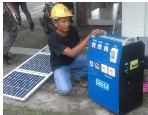
Gambar 5. Produk genset tenaga surya

Setelah rangkaian selesai dibuat, kemudian dipasang bersama dengan warga.