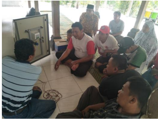
Gambar 2. Pelatihan pengoperasian dan perawatan genset