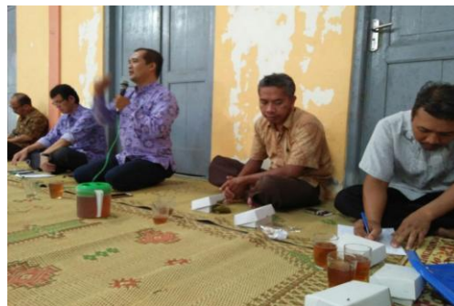
Gambar 1. Sosialisasi program

orang. Kelompok ini berkomitmen untuk menjadi agen penerus teknologi dari tim pengabdian;