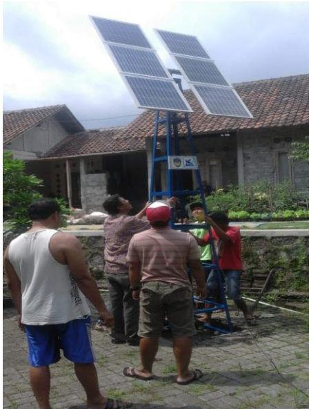
Gambar 6. Pemasangan genset oleh warga