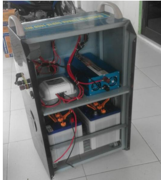
Gambar 4. Mesin Genset yang sudah dirakit

Setelah rangkaian selesai dibuat, kemudian dipasang bersama dengan warga.