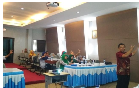
Gambar 3. TIM PKM Memberikan Materi Pembelajaran dan Pendidikan Fisika

Hari kedua pelatihan dilaksanakan pada hari sabtu tanggal 5 mei 2018 di ruang multimedia SMA N 1 Purworejo. Kegiatan pelatihan pada hari kedua yang merupakan materi inti pelatihan dibagi