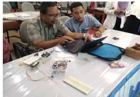
Gambar 3. TIM PKM Memberikan Materi dan Pelatihan E-Learning dan Media Ajar Berbasis Arduino

Diharapkan dengan adanya pelatihan ini maka akan terus dikembangkan pelatihan-pelatihan serupa untuk meningkatkan kualitas pembelajaran fisika berorientasi masa depan dan tidak ketinggalan zaman.