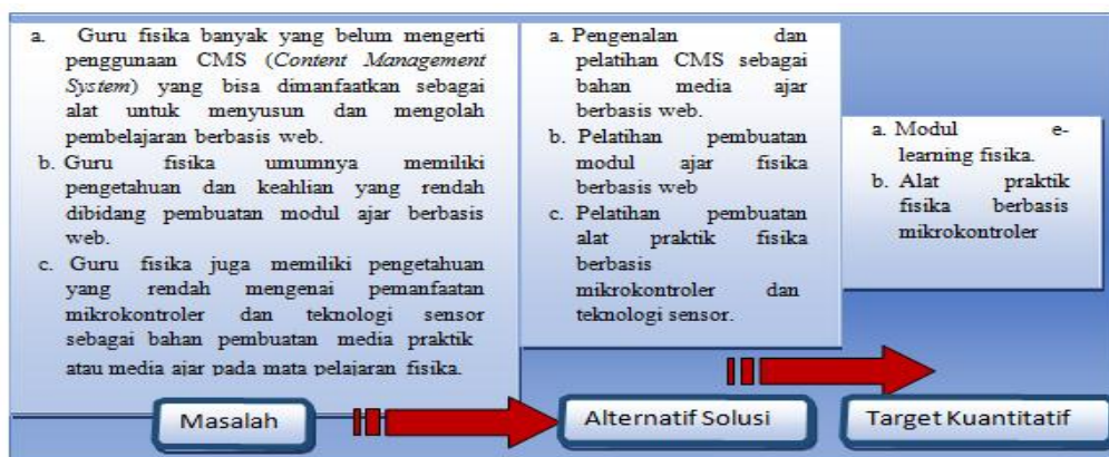
Gambar 1. Bagan Gambaran Masalah, Solusi, dan Target Kuantitatif

diharapkan dengan adanya pelatihan dan pendampingan ini guru fisika Kab. Purworejo meningkat kompetensinya dan semakin berkualitas pembelajarannya.