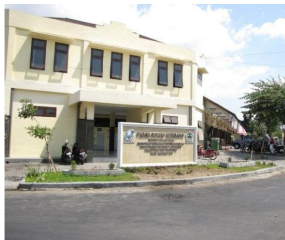
Gambar 1.c Lokasi Pasar Cokrokembang

Pada gambar dibawah ini disajikan aktivitas kegiatan dari mitra kedua