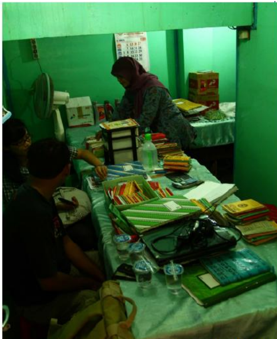
Gambar 1.a Aktivitas pendampingan di pasar kranggan