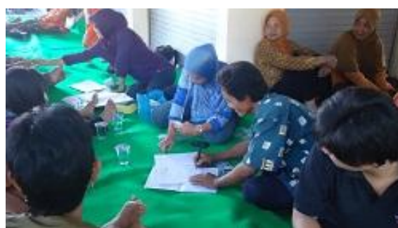
Gambar 1.d Aktivitas pertemuan Rutin

Berdasarkan situasi umum tersebut, maka koperasi perlu memiliki Pedoman Standar Operasional Prosedur Usaha Simpan Pinjam. Diharapkan Pedoman