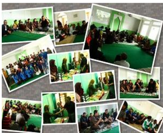
Gambar 1.b Ruang Koperasi

Mitra kedua adalah Koperasi Pasar Cokrokembang, Kec. Tulung Kab. Klaten. Koperasi pasar Cokrokembangdirintis sejak Oktober 2012 dengan keanggotaan dari 58 pedagang di pasar Cokrokembang. Pendiriannya dimotori oleh tim sekolah pasar pada Maret 2013. Modal awalnya