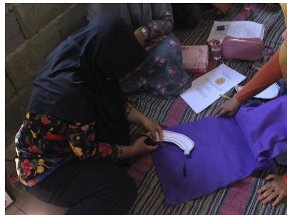
Gambar 4: Proses menggunting pola