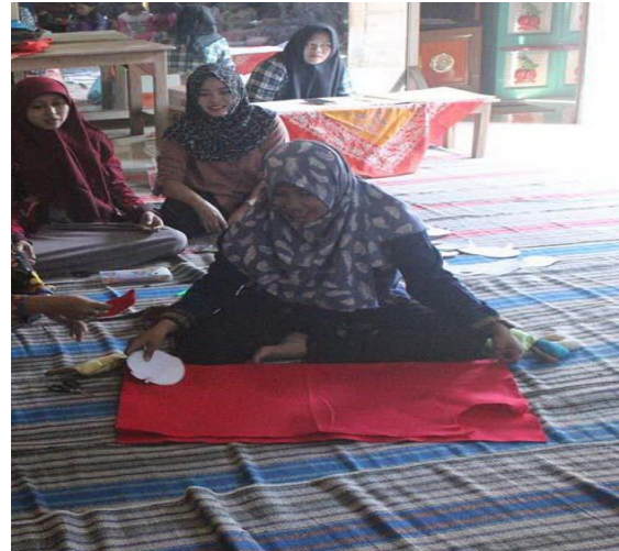
Gambar 3 : Pelatihan cara membuat pola

Selanjutnya peserta dibagi menjadi tiga kelompok kecil yang didampingi tim pengabdian sebagai tutor. Masing-masing kelompok diajari secara langsung tahap pemilihan bentuk yang diinginkan, pembuatan pola dasar dengan menggambar di kertas, menggunting bahan mengikuti pola, proses menjahit, mengisi pola dengan kain perca, proses merapikan, sehingga menjadi Pillow Doll . Tahap-tahap pelatihan pembuatan APE Pillow Doll sebagaimana pada gambar 3, 4, dan 5.