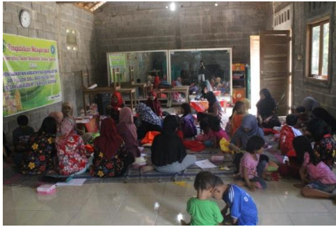
Gambar 2. Pendampingan dalam memberikan Motivasi serta Penyuluhan