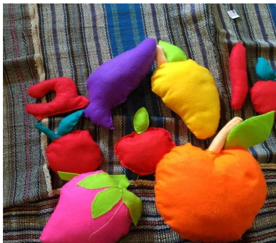
Gambar 7 : Hasil Jadi APE Pillow Doll