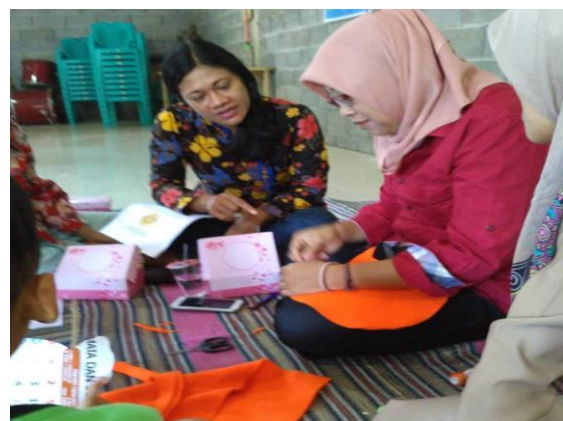
Gambar 6: Proses menjahit