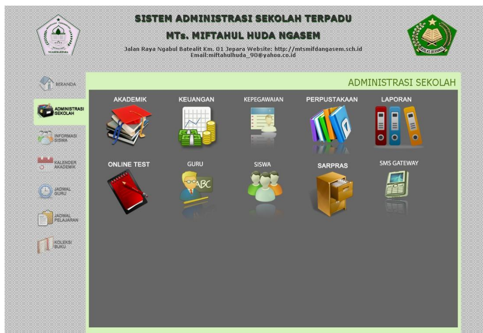
Gambar 1. Menu utama Sidu MTs. Miftahul Huda