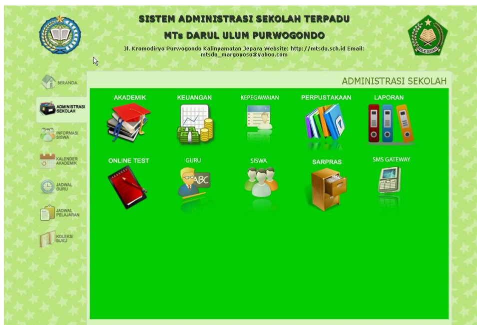
Gambar 1. Halaman Utama SIDU MTs Darul Ulum Purwogondo