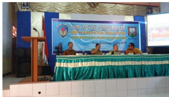
Gambar 1. Pembukaan dilanjutkan dengan pelaksanaan kegiatan