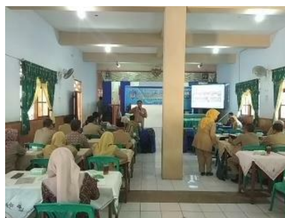
Gambar 2. Pembukaan dilanjutkan dengan pelaksanaan kegiatan

PKM MGMP IPA SMP Kabupaten Semarang mengenai pembuatan media pembelajaran fisika/IPA untuk SMP disajikan pada Tabel 5.1. Pembuatan media pembelajaran fisika/IPA menggunakan power point developer, Phet, Video tracker dan Latex.