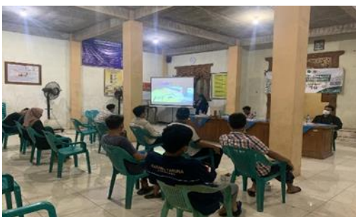
Gambar 1. Penyampaian Materi

Berbekal keterampilan dan kreatifitas Pemuda karang taruna dan Remaja desa, maka tim pengabdian memafaatkan limbah kayu untuk diolah menjadi kerajinan tangan yang berupa gantungan kunci dan aneka kerajinan lain berbahan limbah kayu yang dibentuk dengan teknik grafir laser. Dimana produk tersebut akan sangat berguna dan memiliki nilai jual. Pembuatan produk tersebut dilakukan dengan menggunakan mesin grafir laser. Pengolahan limbah kayu menjadi kerajinan tangan ini memiliki beberapa manfaat, antara lain adalah: 1) dapat menjadi bisnis sampingan yang menambah penghasilan, 2) dapat mengurangi tumpukan sampah yang ada di sekitar lingkungan, 3) dapat mengasah kreatifitas, dan 4) dapat mengurangi pencemaran lingkungan akibat pembakaran limbah organik terutama kayu. Beberapa manfaat tersebut disampaikan oleh narasumber di awal kegiatan untuk menggugah minat dan antusiasme peserta pemuda karang taruna dan remaja desa dalam mengikuti kegiatan seperti gambar di bawah ini.