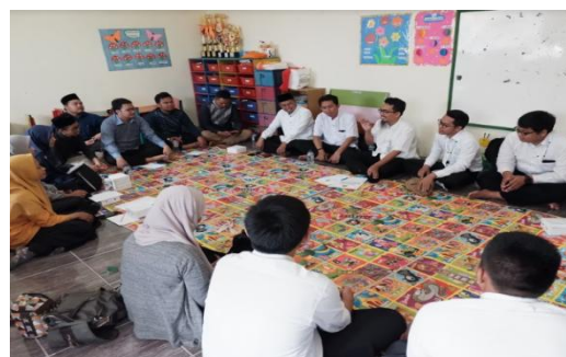
Gambar 4. Sesi sharing dengan suasana santai

Berdasarkan hasil sharing, diketahui para pegawai belum sepenuhnya memahami konsep akrual di dalam penyusunan laporan keuangan.