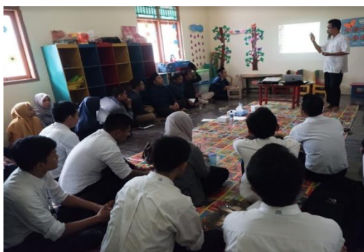
Gambar 5. Materi awal disampaikan di ruang kelas Taman Kanak-Kanak

menerapkan basis akrual. Setelah penyampaian materi, dibuka kembali sesi dialog untuk menggali kembali isu-isu penting terkait penyusunan laporan keuangan. Dalam sesi ini, peserta diberikan hand-out untuk dipelajari sebagai persiapan pelatihan pada hari kedua.