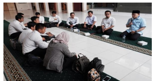
Gambar 2. Mendengarkan sambutan pimpinan YPI-PPA

Selama ini, laporan keuangan yang disusun hanyalah berupa aliran masuk dan aliran keluar uang tunai pada masing-masing tingkatan sekolah, yaitu laporan keuangan Taman Kanak-Kanak, laporan keuangan Sekolah Dasar, laporan keuangan Sekolah Menengah Pertama, dan laporan keuangan Sekolah Menengah Atas. Meskipun bertajuk laporan keuangan, namun pada hakikatnya laporan yang dihasilkan baru sebatas laporan arus kas.