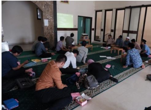
Gambar 7. Penyampaian materi oleh mahasiswa

bangunan pesantren yang dikenal sebagai masjid untuk program tahfidz alquran.