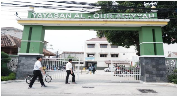
Gambar 1. Pintu Utama YPI-PPA