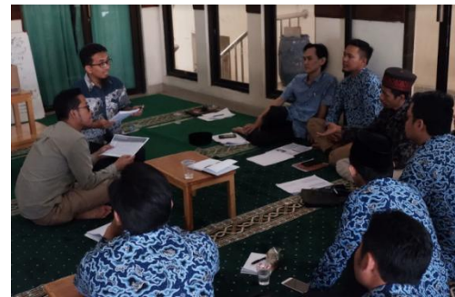
Gambar 8. Diskusi interaktif

Materi yang tidak kalah pentingnya untuk disampaikan adalah mengenai inventarisasi aset. Persoalan utama Yayasan ini adalah belum adanya daftar aset yang komprehensif menggambarkan kekayaan YPI-PPA sebagai sebuah badan hukum. Disamping itu, Yayasan juga belum membuat daftar inventaris barang di tiap ruangan maupun menyusun kodefikasi barang. Oleh karena itu, persoalan aset dibahas secara intensif setelah sesi pemaparan konsep dasar akuntansi.